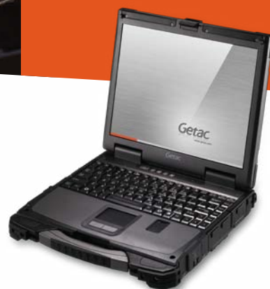
/ Getac B300 / Fully Rugged Notebook

Полностью защищенный ноутбук Getac B300 был успешно интегрирован в новую платформу охраны правопорядка Департамента полиции г. Сан Хосе при модернизации ИТ системы и эффективно снижает затраты на техническое обслуживание и время простоя оборудования, что позволило полицейским выполнять свои обязанности по охране правопорядка с большей мобильностью и гибкостью в экстремальных условиях патрулирования.